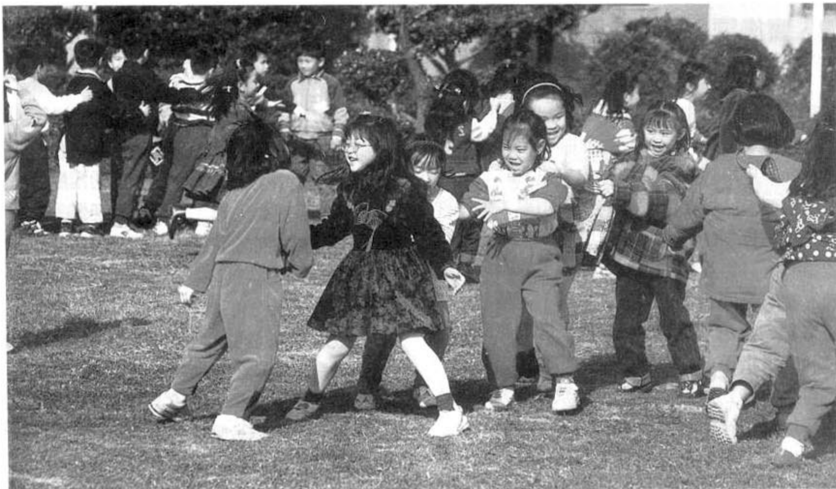
「平時即應教導學生如何防範性騷擾」